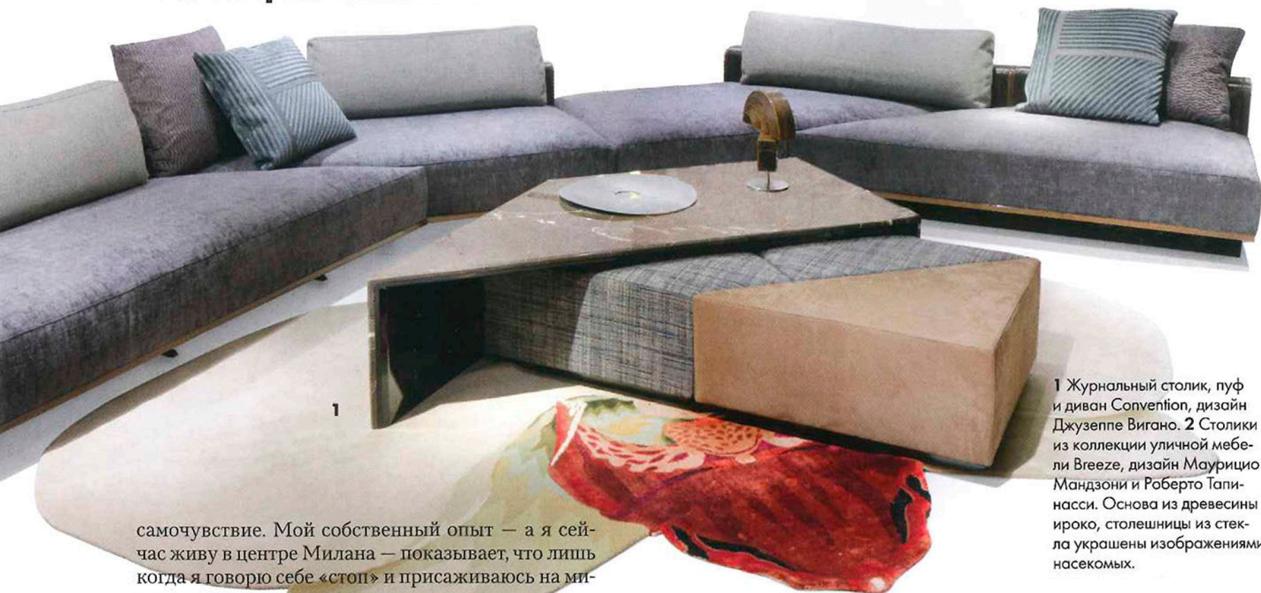
1 Журнальный столик, пуф и диван Convention, дизайн Джузеппе Вигано. 2 Столики из коллекции уличной мебели Breeze, дизайн Маурицио Мандзони и Роберто Тапинасси. Основа из древесины ироко, столешницы из стекла украшены изображениями насекомых.

самочувствие. Мой собственный опыт — а я сейчас живу в центре Милана — показывает, что лишь когда я говорю себе «стоп» и присаживаюсь на минутку отдохнуть и отдышаться в парке или любом другом зеленом уголке, силы и энергия вновь возвращаются ко мне. Вот почему в этом году мы решили представить в Милане не просто коллекцию мебели, а именно комплексный архитектурный проект, включающий настоящий зеленый сад с живыми растениями, который легко можно воспроизвести в любом доме любой точки планеты.